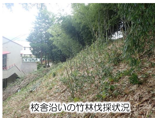
校舎沿いの竹林伐採状況