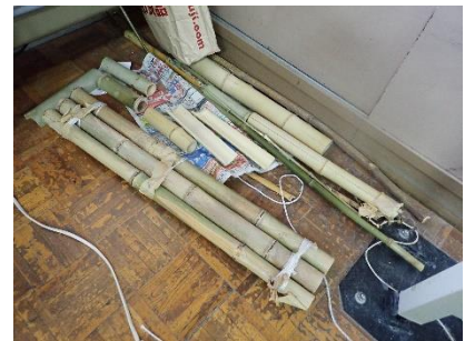
竹を使った工作の例