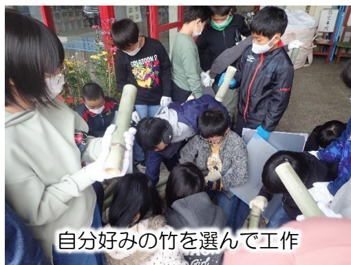
自分好みの竹を選んで工作