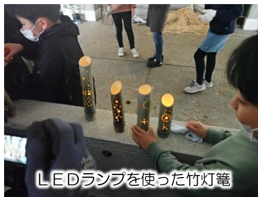
LEDランプを使った竹灯籠

活動の様子は長野県魅力発信ブログ「 ほっと9(ナイン)ながの 」で紹介しています。豊野西小以外の取組も紹介していますので、是非ご覧ください。