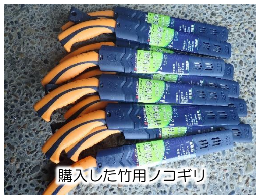
購入した竹用ノコギリ