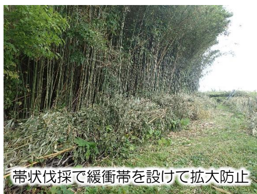
帯状伐採で緩衝帯を設けて拡大防止