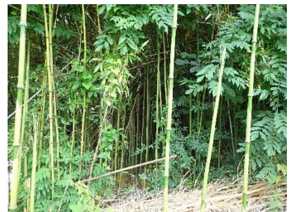
過密化した竹林の状況