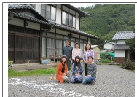
【農泊受入れの様子】

「C」: 一定の事業効果はあったが事業実施方法や今後の活用等について、工夫や改善を要する点がある