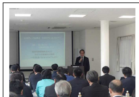
【そばのアレコレセミナー 長野会場】

そばきり以外にもそば料理があり、ただそれを伝えるのではなく、そばによる6次産業化やアンチエイジングからみたそばのセミナーを実施。多くの方に参加頂いた。