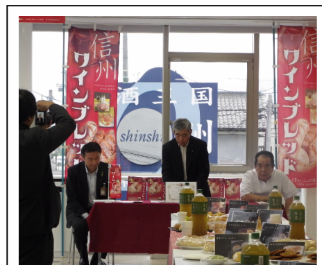
【製パン講習会試食発表会の様子】