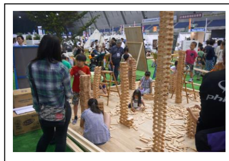
【6/9-10 積み木で遊ぶ様子】

来場者に向け、県産材を用いた遊具やパネル等を用いてPRする。またイベントに向けて製作した遊具(特に積み木)を用い、保育園への訪問木育事業を行った。長野・千曲・中野の8保育園を訪問し、県産材のPRをした。また信州大学付属小では、積み木で遊ぶだけでなく、地元林業、県産材活用についての授業を北相木村役場の協力を得ながら行った。