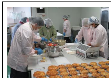
【施設でのアップルパイ製造】