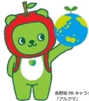
長野県PRキャラクター 「アルクマ」 ©長野県アルクマ