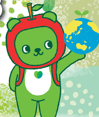
長野県PRキャラクター「アルクマ」 ©長野県アルクマ