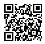
▲参加申込フォーム