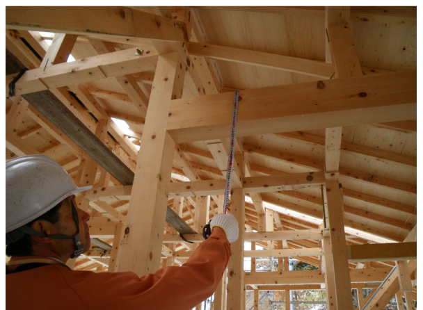
構 造 材