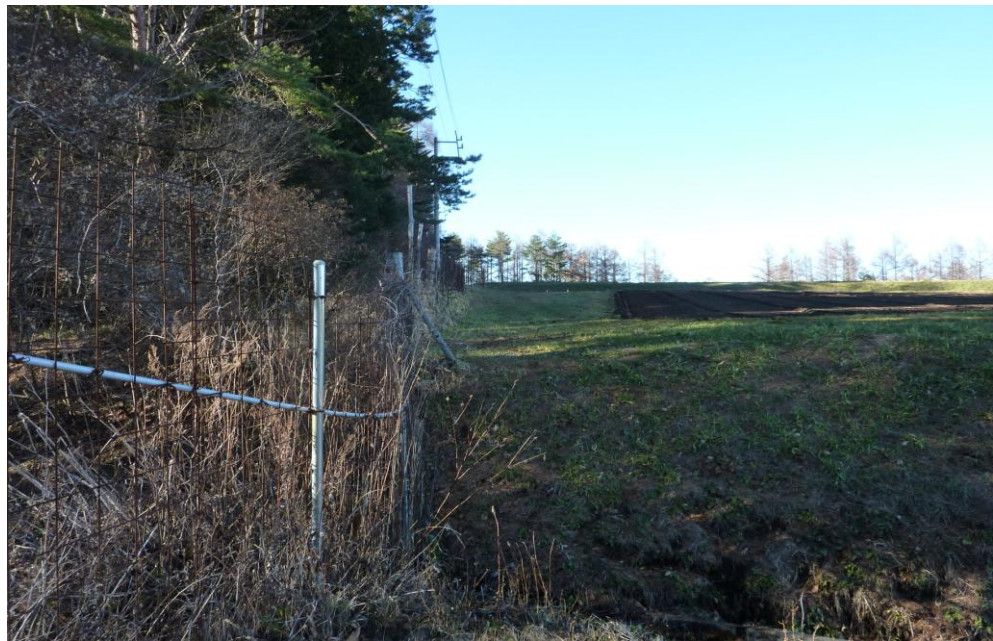
(7) 11月26日 13:53 撮影