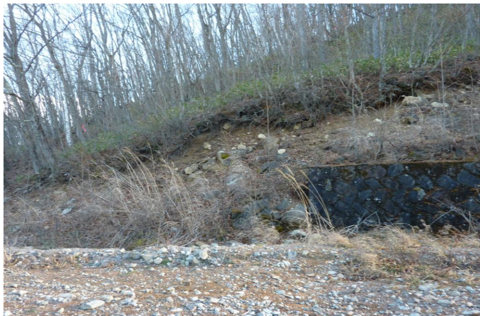
(11) 11月26日 14:33 撮影