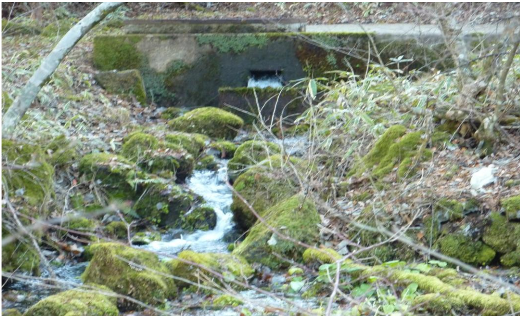
(3) 11月26日 13:40 撮影