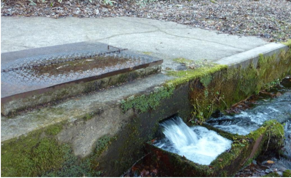
(1) 11月26日 13:37 撮影