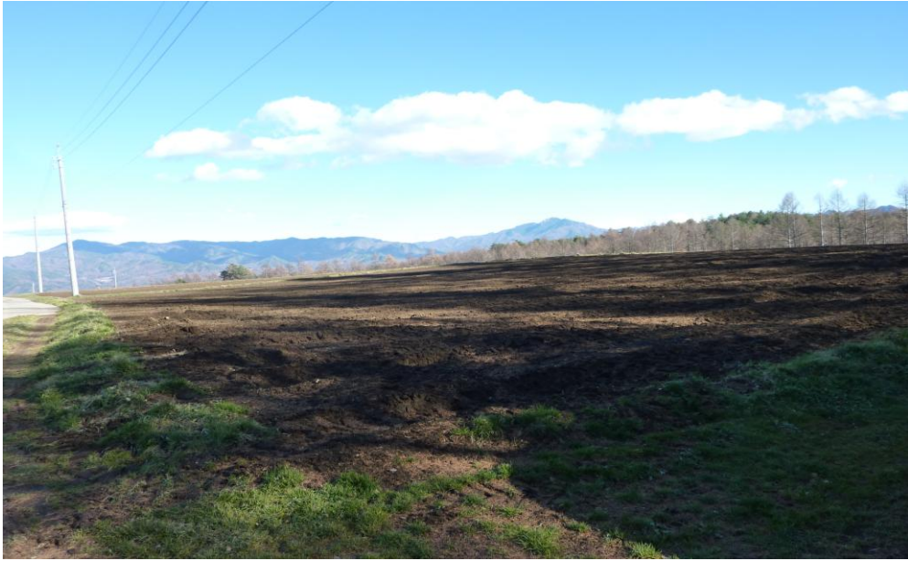
(5) 11月26日 13:52 撮影