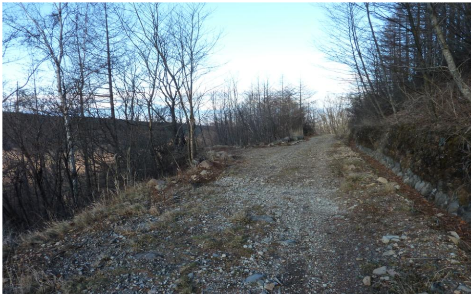
(9) 11月26日 14:30 撮影