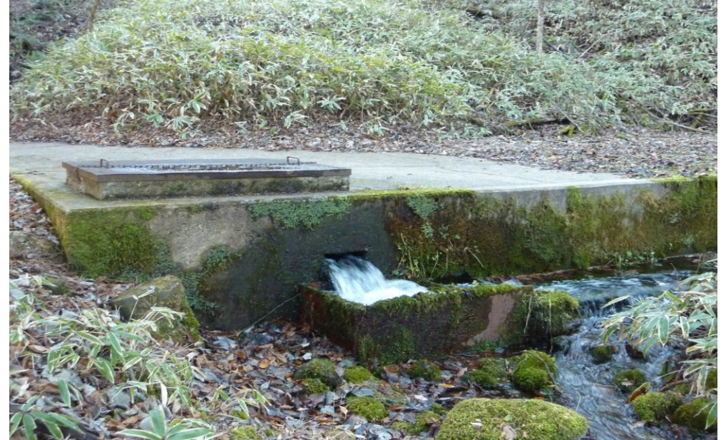
(2) 11月26日 13:38 撮影