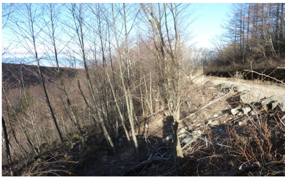
(10) 11月26日 14:31 撮影