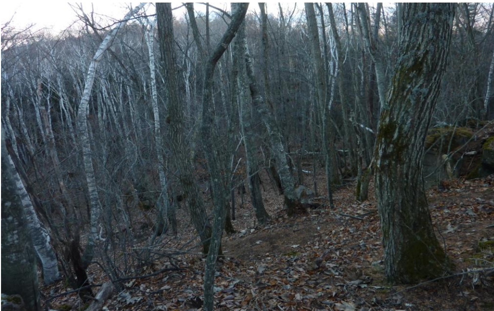
(15) 11月26日 14:38 撮影