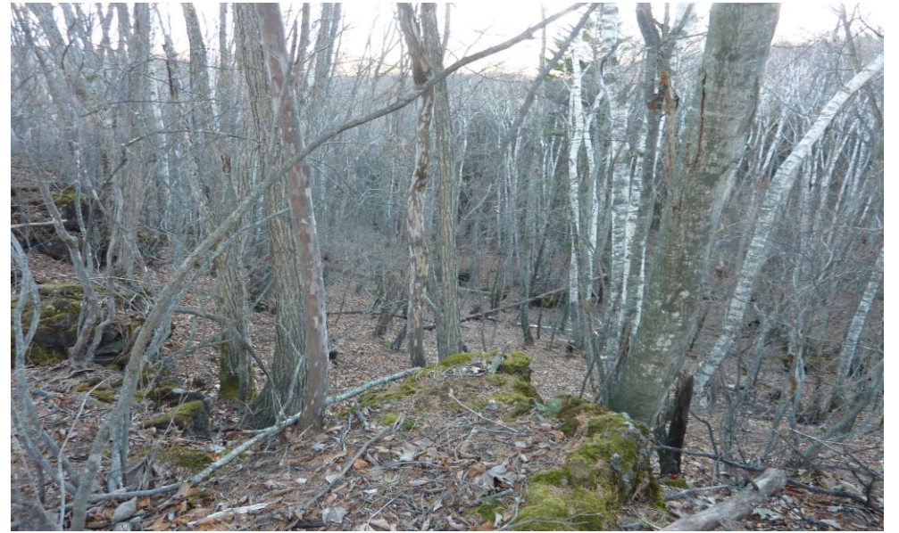
(14) 11月26日 14:37 撮影