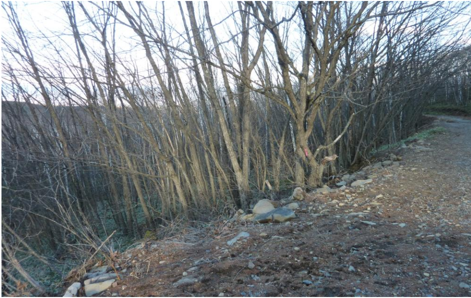
(13) 11月26日 14:33 撮影