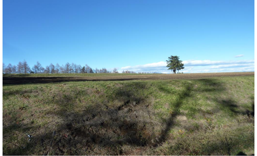
(6) 11月26日 13:52 撮影