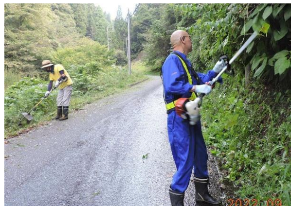
【道路の草刈り作業】