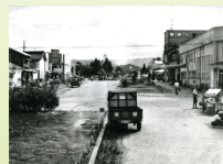
区画整理実施後 (昭和27年)