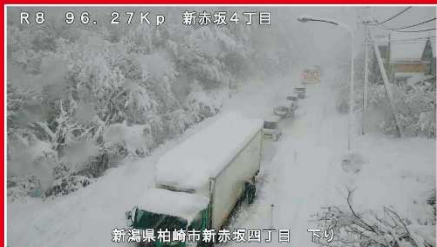
RB 96、27Kp 新赤坂4丁目 新潟県柏崎市新赤坂4丁目 下り 令和4年12月19日 国道8号(登坂不能車による交通障害の発生状況)