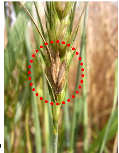
赤丸内（褐変している部位）が赤かび病感染部位