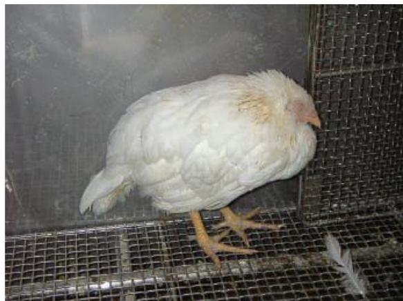
高病原性鳥インフルエンザウイルスに感染し、元気をなくしている鶏