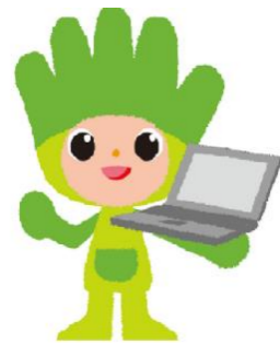
長野県ものづくり人材育成応援 キャラクター わざまる