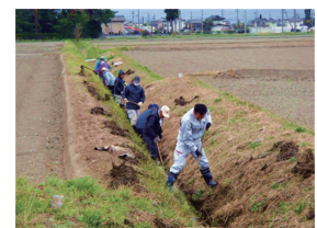
【共同活動による排水路の泥上げ】