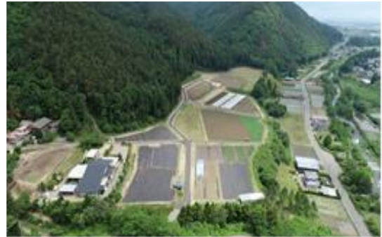
【県営中山間 あさひ地区 御道開渡工区】