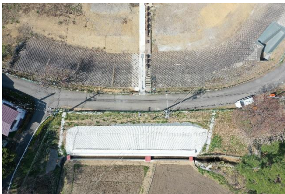
【小坂田ため池の耐震補強（塩尻市）】