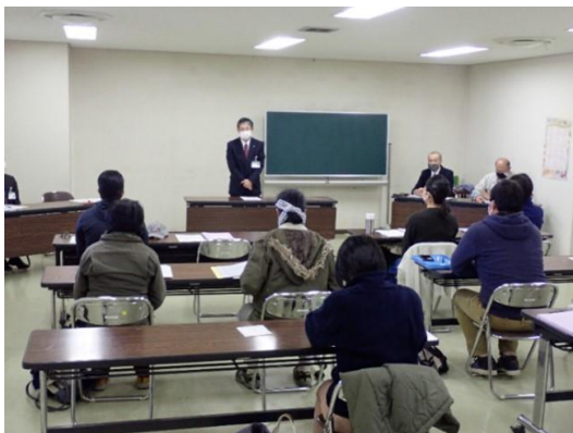
【アグリマスターセミナー（経営管理コース）】