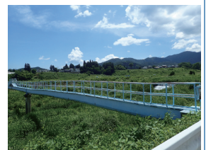
【農業用水を送水する水管橋】