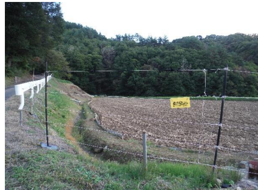
【協定集落への電柵設置（麻績村野間）】