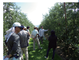
【新規就農者の研修会】