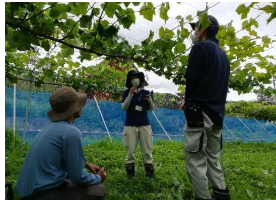
【研修生の巡回指導（生坂村）】