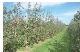
【りんご高密度植栽培・新しい化栽培】