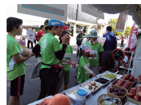
【松本マラソンでの地元農産物のPR】