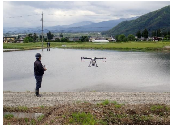
【無人航空機を活用した水田除草】