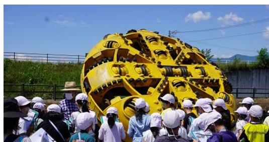
梓川を横断するサイホンの掘削資材の見学

※取材の際は事前に担当者へ連絡願います。また、撮影にあたっては、引率教諭の指示に従ってください。