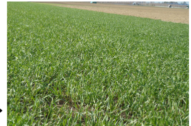
【緑肥麦による防止対策】 →