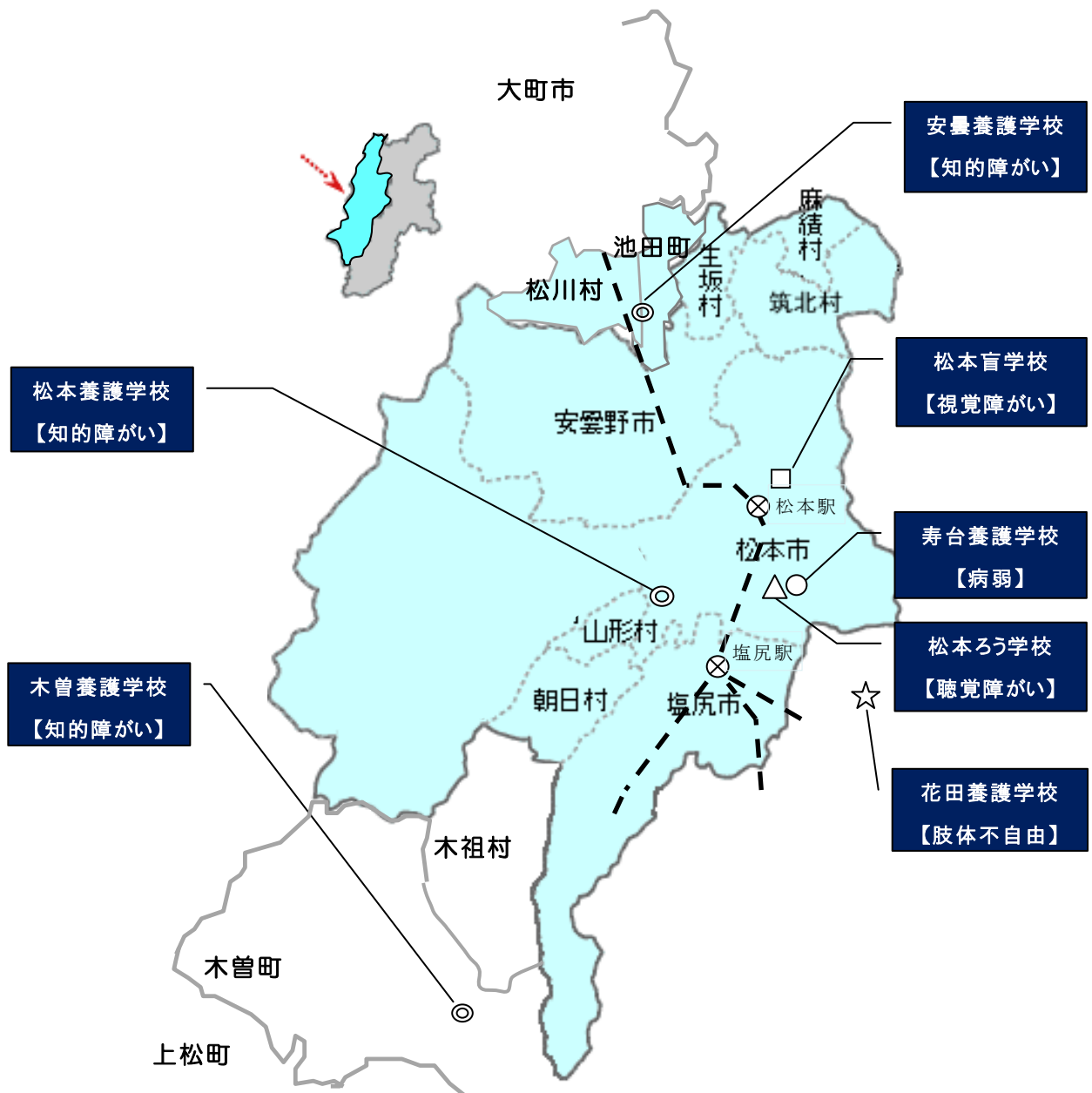
中信地区特別支援学校の配置