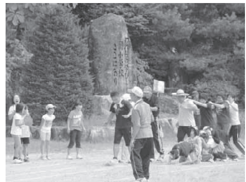
公民館活動（運動会）