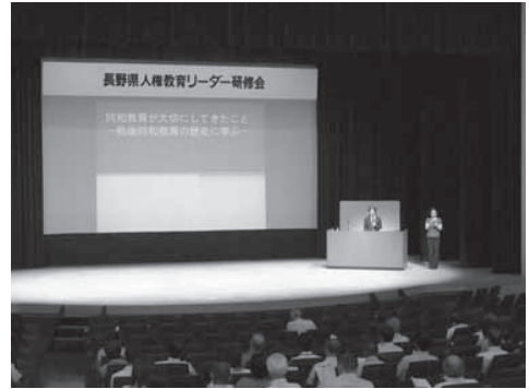
長野県人権教育リーダー研修会