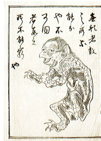
「つうふうの妙茶」内包紙下書 (天竜かっぱ広場おもしろかっぱ館蔵)

中村家では、実際に1944(昭和19)年まで痛風薬の製造・販売を行っており、最盛期には、全国各地から注文が入り、朝鮮や樺太からの注文書も残っています。異界である水の世界と河童が結びつき、薬という不思議な力を持つ存在につながったとも考えられます。