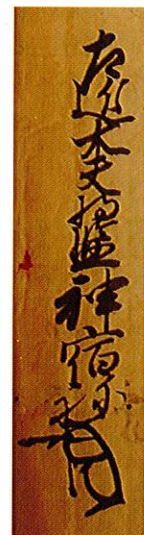
奉行人諏方晴長の署名 「左近太夫将監神宿の者」

ところが昨年、県内の旧家より寄贈された史料のなかからこの時の奉行人と奉公衆の対立の原因を示す公文書の案文（控え）が見つかったのです。これによれば、この年の正月、慣例を破って奉公衆より先に奉行人たちが將軍義尚に御目見得をしたのが「先代未聞」だとして訴訟になり、双方がメンツをかけ何度も論難し、ついに一触即発の乱闘に発展しそうになったというのです。政治史の新たな新発見となるこの文書は現在調査中で、さらなる解明が待たれます。（村石正行）