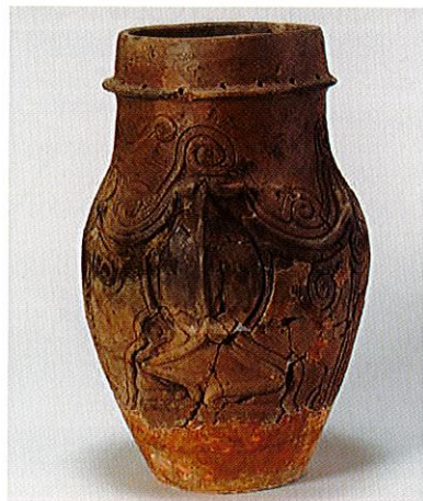
宮田村中越遺跡 蛙状装飾付有孔罎付土器 縄文時代中期 (宮田村教育委員会蔵)

また、水の世界を人の世界とは違う「異界」との考えのもと、水辺がこの世の穢れを異界へ送る場になりました。千曲市屋代遺跡群の水辺の祭祀