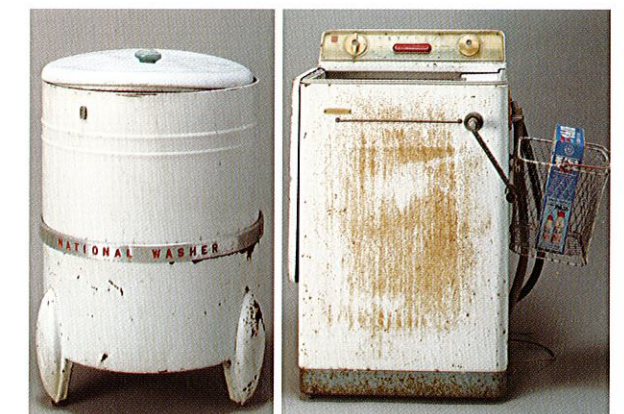
攪拌式洗濯機 1952(昭和27)年製造

が、本体右側には、ハンドルを回して衣類を絞る「ローラ絞り機」が付いています。洗い終わった洗濯物を二本のゴム製ローラの中に挟み込み、ハンドルを回して絞ると、するめのような洗濯物が反対側から出てきます。当初は洗濯機のふたで洗濯物を受けていましたが、昭和30年代半ばになると、横に引っ掛けた「洗濯かご」の中に納めるようになりました。