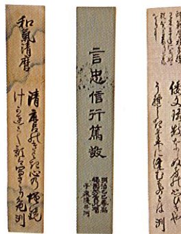
浅井泷自筆短冊 (重要文化財旧開智学校校舎蔵)