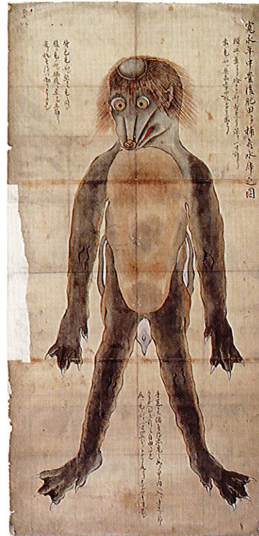
寛永年中豊後国肥田ニテ捕候水虎之図 (川崎市市民ミュージアム蔵)