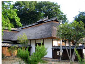
県宝「松田家住宅主屋」

その他未指定文化財で、松田家齋館増築棟が一部焼損、味噌蔵保管の書籍類の表面焦げや水濡れの被害があった。