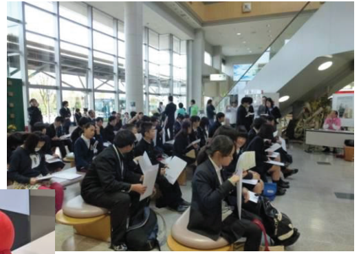
表彰式を待つ生徒さんたち 保護者の方も大勢みえました