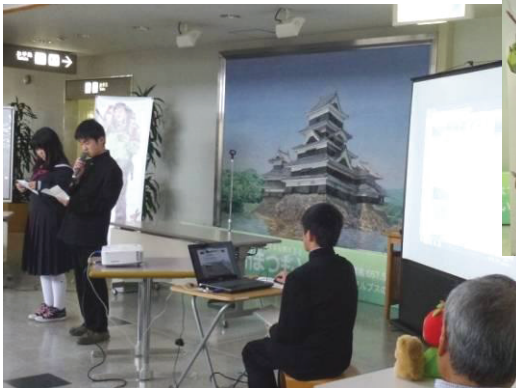
ホームページの工夫点などについて発表