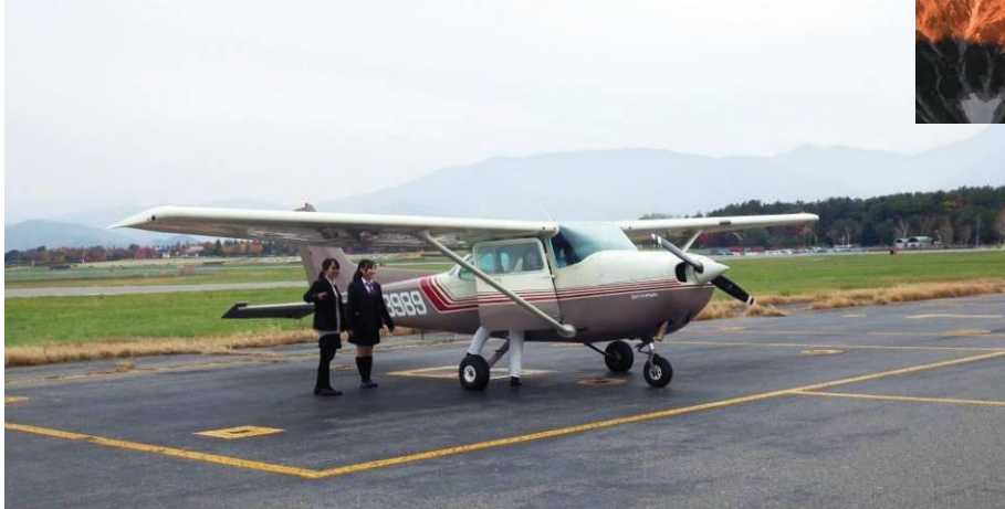
セスナ機にはパイロットを 含め 4 人が一度に搭乗でき ます。