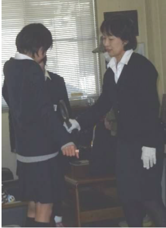
通常の飛行機と同様に、 身体チェックをしてから搭乗