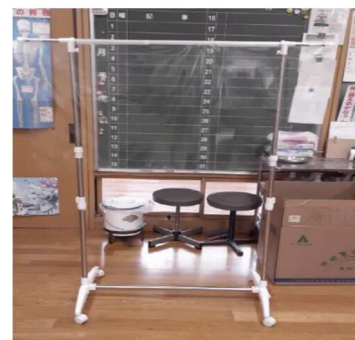
キャスター付きラックにビニールシートをつける