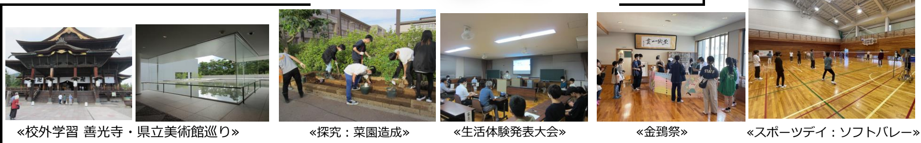
«校外学習 善光寺・県立美術館巡り»