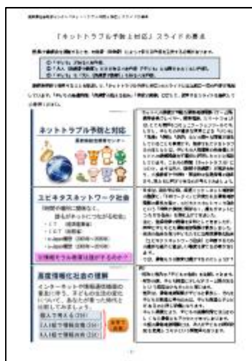
スライドの要点 (簡易的な読み原稿)