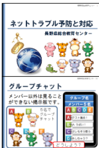
スライド資料 (スライド62枚)