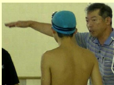
Aさんにアドバイスするお父さん

さんは、顔いっぱいにあふれるくらいの笑みを浮かべると、ジェスチャーを交えながら、Aさんに何やら伝えていました。そして、Aさんの両肩をポンポンと叩くと、また、プールサイドの端っこへと引き上げていきました。