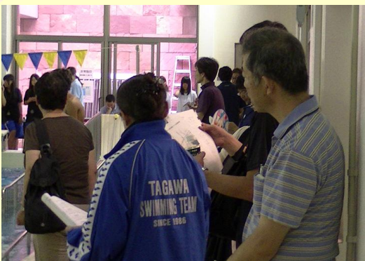
Aさんの様子を見つめるお父さん

Aさんのあり様を見極める厳しい目(激励の眼差し)。その両方の視線を、プールのサイドの陰から絶え間なく注いでいるのは、Aさんのお父さんでした。