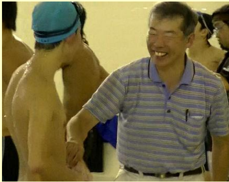
Aさんのがんばりを賞賛するお父さん

自閉症の息子は、算数は大好きで、意欲的に取り組んでいたけれども、他の学習や活動では、なかなか自分の力を発揮することができませんでした。学んだことが一つにつながっていくことはありませんでした。私の中で、「このままだともできない、達成感の少ない息子になってしまふ。自分一人で、自分のペースで、自分らしく生きていく力を身につけさせてやりたい。」といった思いが強くなっていきました。