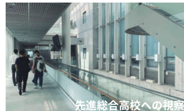
先進総合高校への視察

既存施設の現況調査と、類似先進施設への視察を計画初期に実施し、既存建物の課題と新施設の目標設定や空間のイメージを共有します。視察は感染症の被害拡大など情勢次第では、勉強会での代替も検討します。