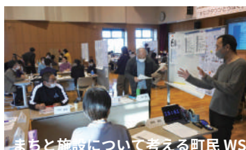
まちと施設について考える町民WS

高校内部のことだけでなく、まちの資源の発掘や具体的な連携方法、OBOGとの繋がりなども考えていきます。学校づくりへの関心を高め、多様な人が学校づくりを自分ごととして捉え、長期的に高校づくりに関わる仲間を集めます。