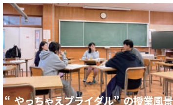
“やっちゃえブライダル”の授業風景

現在、商業科で地域講師によって実践されている“やっちゃえブライダル”のノウハウを生かし、新たな地域講師の発掘と模擬講座の実施を検討します。講座の頻度や時期の調整などの課題の解決を図りつつ、講師が長期的に携われるシステムを高校教職員の皆さんとともに同時に検討します。