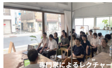
専門家によるレクチャー

設計チームの建築家や構造家により学校づくりに必要なプロセスや技術などの建築づくりのレクチャーを行います。大きな模型やイメージパースを用いて生徒の興味関心を高め、卒業後も赤穂新校の計画を語り広められる基盤を作ります。