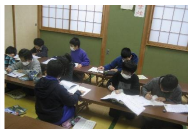
下校後、宿題に取り組む