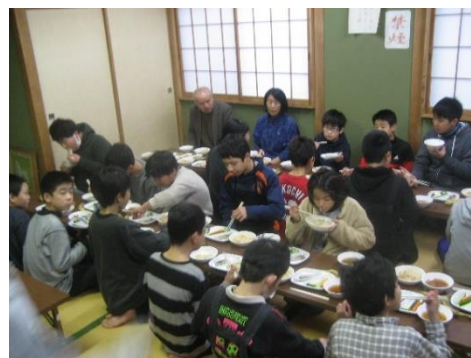
7:00 朝食 (全員で準備・片付け)

子どもたちの様子について、スタッフの一人である社会教育委員さんに尋ねると、「子どもたちで、どうしたらいいか話し合って解決します。いつもすごいって思います。」と、子どもの成長を語っていただきました。また、「通学合宿で、私たち大人のつながりもできました。」と、地域づくりにもつながる取組であることを教えてくださいました。