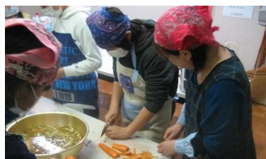
スタッフと一緒に夕食作り