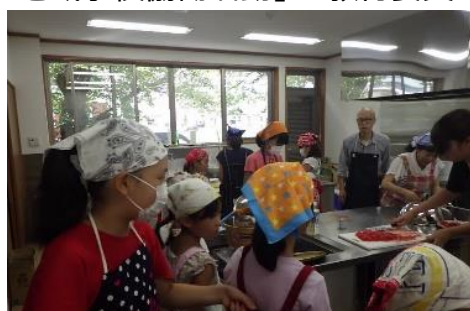
「子ども食堂」と連携した夏休みの活動

地域学校協働活動の一つとして、国庫補助事業の「放課後子ども教室」（放課後等の児童・生徒の豊かな学びを支援）や「地域未来塾」（放課後等の中学生の学習支援）などがあります。また、CSの取組として、休日や長期休業中に学習支援や体験プログラムを実施したり、子ども食堂と連携したりして、子どもの居場所づくりを進めている自治体や学校もみられるようになりました。