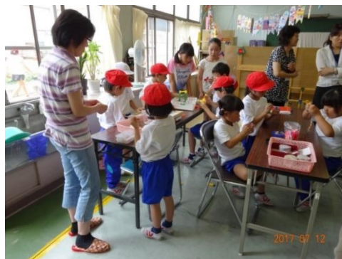
空き教室を利用した「ガンバルーム」で遊ぶ子どもたち

ガンバルームは月・水・金の 2 時間目休み、地域のボランティアが子どもたちにいろいろな遊びを提供しています。また、毎週水曜日は清掃の時間をなくして、給食の後 30 分間をたっぷりと自由に過ごせる「わくわくタイム」がある時間にもガンバルームは開いています。