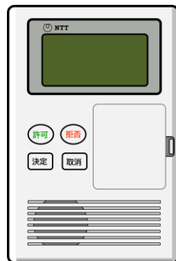
特殊詐欺対策アダプタ

お問い合わせ先 （申し込み・料金等に関するお問い合わせ） NTT東日本 特殊詐欺対策サービス受付センター ☎ 0120-252373 （受付時間 平日9:00~17:00）