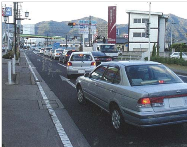
① 国道18号の交通状況 (上田市内)