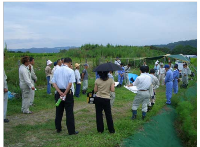
② 用地立ち会い状況 H23. 8