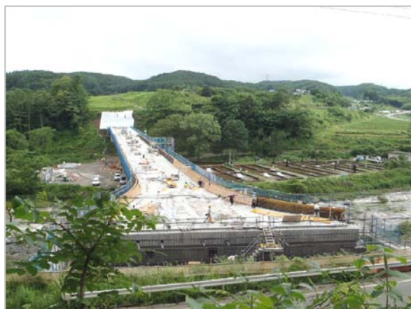
② 工事が進む八千穂 IC (仮称) 付近