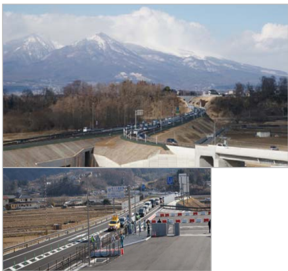
① 開通日の佐久南 IC 付近