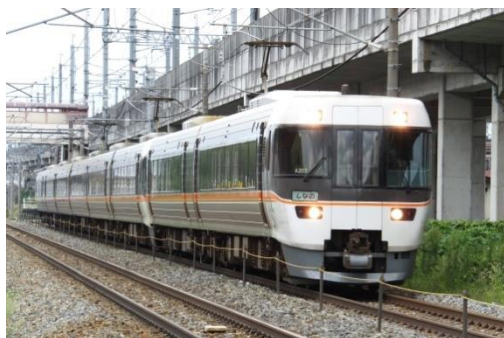
特快 信浓 (名古屋-松本-长野)