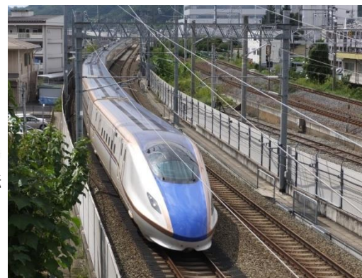
北陆新干线 (东京-长野-金泽)