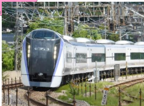
特快 梓号 (东京-松本-南小谷)