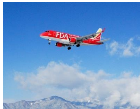
松本机场 (松本-福冈, 松本-札幌, 松本-大阪)