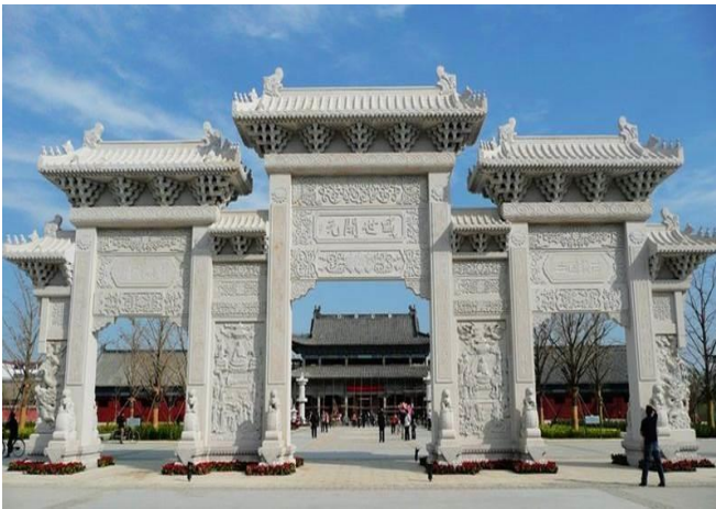
カイゲンジ 唐代開元寺