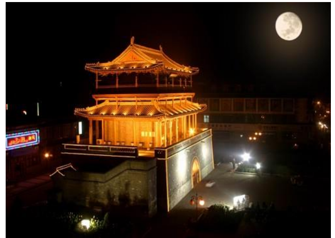
シンフウロウ 明代清風楼