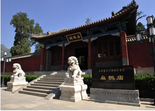
ヘンジャクビョウ 扁鹊廟 (戦国時代の漢方医の墓)