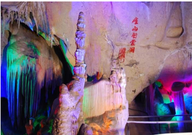
コウサンハクウンドウ 崆山白雲洞 (約 5 億年前にできた鍾乳洞)