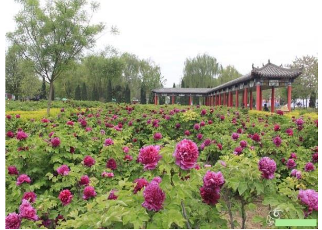
漢代牡丹公園 (漢時代から続く伝統ある花)