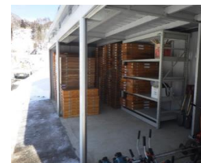
土尻川砂防事務所