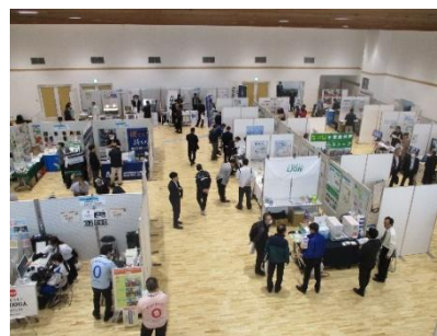
環境産業見本市 会場の様子 (10/31)