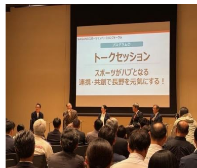
NAGANOスポーツイノベーションフォーラムの様子 (10/14開催)