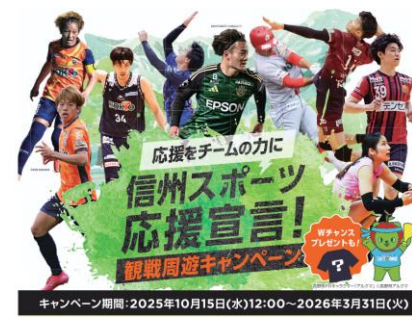
お得に試合を観戦できる周遊キャンペーンを実施中！（～3/31）