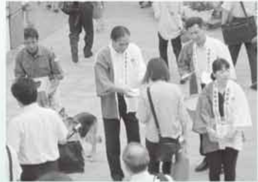
長野県みらいベースの広報・寄付募集活動 (上：長野駅前 下：松本駅前)