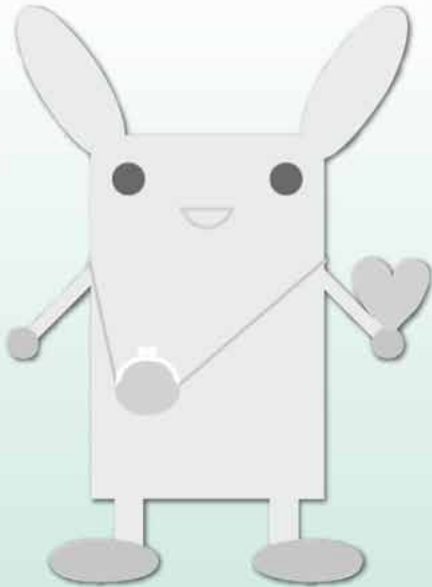
長野県みらいベースのキャラクター 「キッフィー」