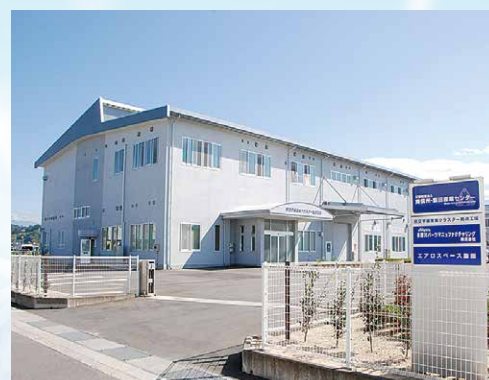
航空機部品の熱処理など特殊工程を行うための拠点工場を整備（飯田市内）