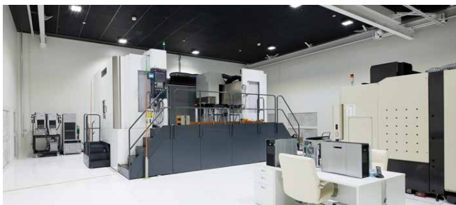
地下11mに眠る 超精密夢工場

これからの時代は、国内だけでなく海外市場にも目を向け、いく必要がありますが、「確かな品質」にこだわりたいので、