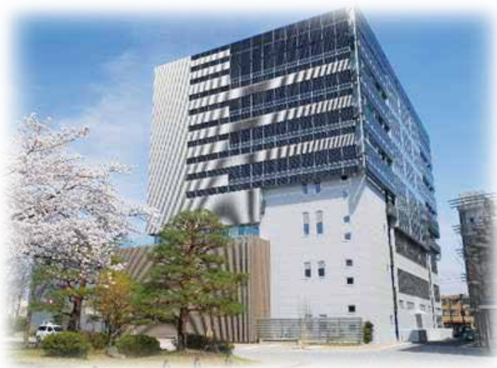
信州大学国際科学イノベーションセンター(AICS) 》

信州大学など研究機関が持つ革新的な炭素素材・繊維素材の研究成果と、長野県などの企業が持つものづくり技術を生かして産学官連携により取り組んでいるのが、最長9年間にわたる国家プロジェクト「 アクア・イノベーション拠点 」です。