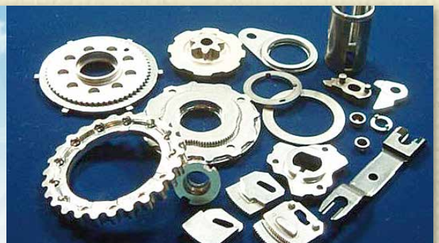
認定された工法により製造した(株)サイバックコーポレーションの自動車部品