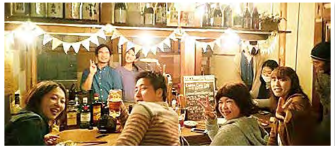
毎晩新たな出会いが始まる・・・

交流の機会を増やしたいという私のこだわりで、宿泊者以外の方も利用できるバーを1階に備えました。宿泊者、地域の方、私たちスタッフの交流が自然と深まるような雰囲気を作り出せているのではないかと感じています。旅行者の皆さんにとっては、ガイドブックに載っていない貴重な情報を地元の方から聞くことができ、地元の方にとっては、当たり前すぎて気付かなかった地域の良さを旅行者から教えてもらえる場にもなっています。