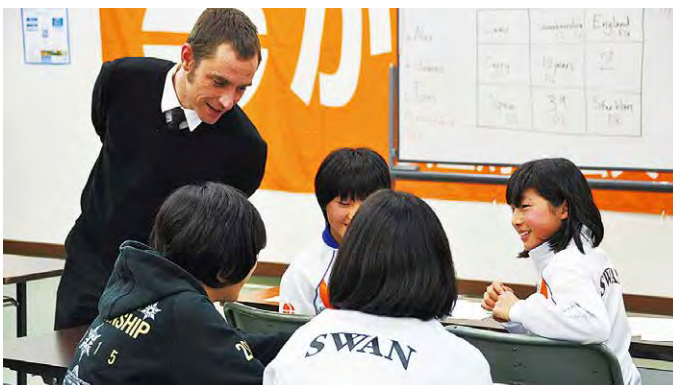
海外遠征に備え、語学を学ぶ

A 全国中学校体育大会において、メンバーから優勝者が出ています。また、修了生もインターハイや国体などの全国規模の大会で優勝や上位入賞するなど活躍しています。