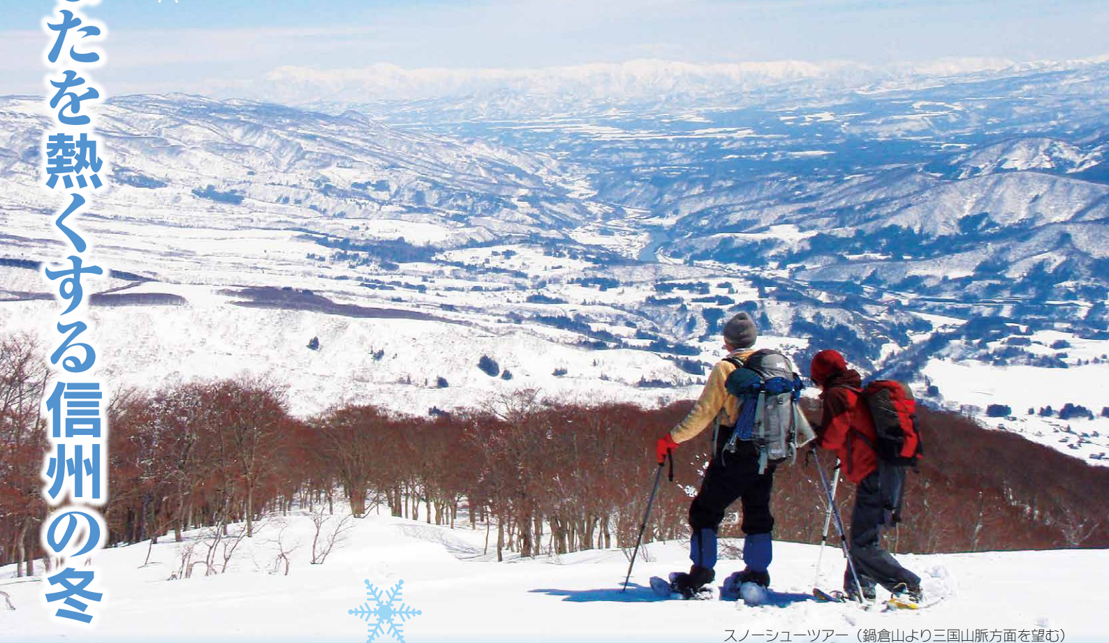
スノーシューツアー（鍋倉山より三国山脈方面を望む）

毎年多くの人でにぎわう全国有数のスノーリゾート 信州 多彩な冬のアクティビティ体験、冬季競技の未来のメダリスト育成など ホットな信州の冬から目が離せません