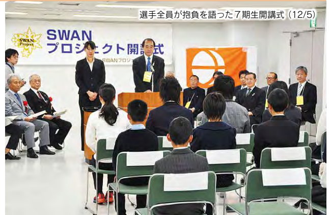
選手全員が抱負を語った7期生開講式(12/5)

「冬季オリンピックの開催県から未来のオリンピックメダリストを輩出する」 夢への挑戦は、これからも続きます。