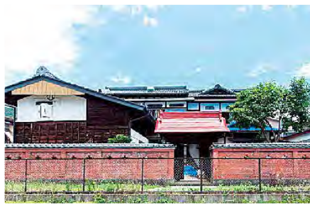
印象的な赤レンガの門構えはそのままに

旅行で山口県萩市のゲストハウスを利用した際に、そのオーナーが紹介してくれたお店や人物と接するうちに、萩市のことを全く知らなかった私が気付いたら萩市のファンになっていたという貴重な経験をしました。これを機に、東京や京都のような観光地よりも、地方都市で