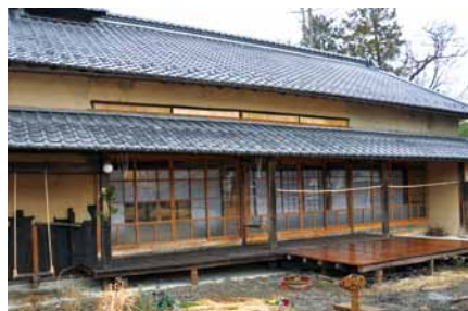
築100年以上の古民家のご自宅

実家は愛知県ですが、父がアウトドア好きだったこともあり、小さいころから長野県も含めて田舎の方に来ていたり、語