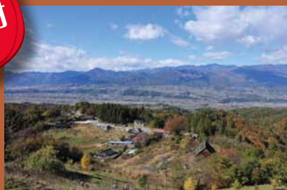
段丘の上から望む伊那谷

長野県の南部、下伊那地域に位置する豊丘村。天竜川が作り出した日本有数の河岸段丘地帯に広がり、リンゴ、ナン、モモなどの果物やマツタケの産地として知られる自然豊かな村です。