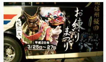
ラッピングバスで情報発信

7年に1度の「飯田お練りまつり」を観光客の誘客はもとより若者の里帰りの機会と捉えました。継承に苦労している伝統芸能に興味を持ってもらうよう、ポスターデザインや伝統芸能体験デーの開催など若者を巻き込んだ積極的な広報に取り組み、当日は過去最高の出演団体数、来場者数となりました。