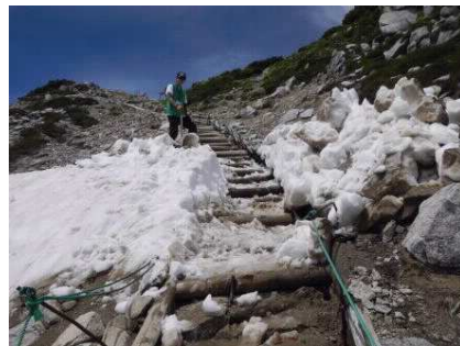
登山道の除雪作業