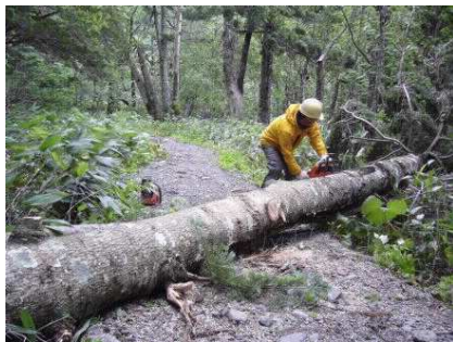
登山道の倒木撤去