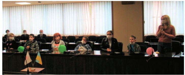
県庁にいらっしゃったウクライナ避難民の皆さん