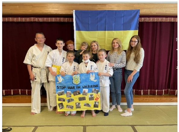
＜長野県高森町に避難したウクライナの方々＞

ウクライナ侵攻による避難民の受入れは、一国では解決できない問題となっています。この問題を解決するためには、世界は繋がっていることを意識し、グローバル社会に生きる私たちが平和な社会を実現することが何より大切なことであると信じています。長野県は、このような状況に置かれた方々を温かく支援したいという賛同者のお気持ちを受け止め、少しでも笑顔になれるようサポートを行ってまいります。