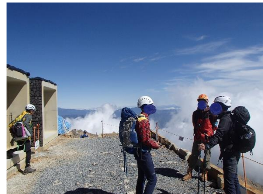
登山者への安全啓発