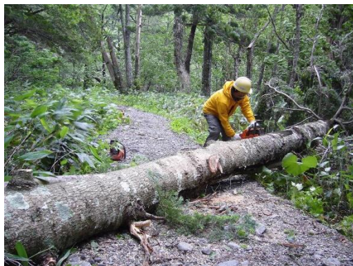
登山道の倒木除去