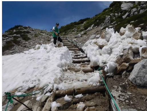
登山道の除雪作業