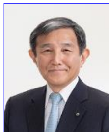
メッセージ WAJ会長 仁坂吉伸氏 (和歌山県知事)