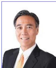
主催者あいさつ 長野県知事 阿部守一