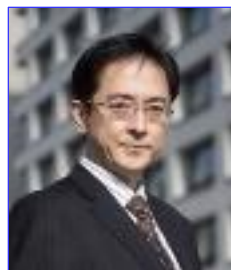
講演 総務省審議官 箕浦龍一氏