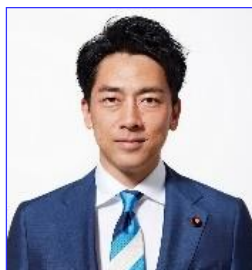
メッセージ 環境大臣 小泉進次郎氏