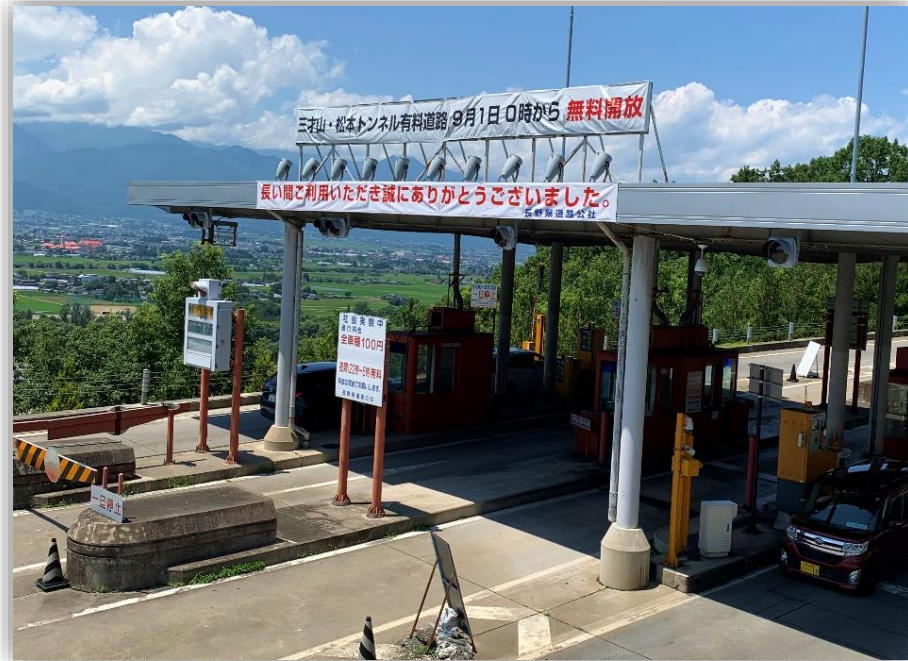
松本トンネル有料道路