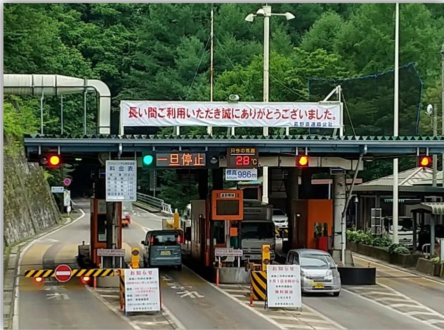
三才山トンネル有料道路