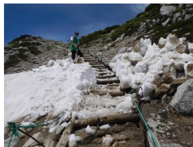
登山道の除雪作業