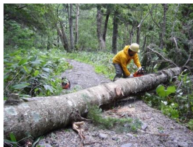
登山道の倒木撤去