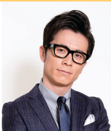
オリエンタルラジオ 藤森 慎吾（諏訪市出身）