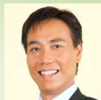
長野県知事 阿部 守一