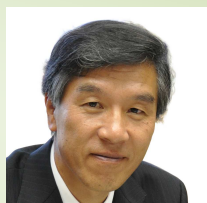
長野県飯山市長 足立 正則 氏