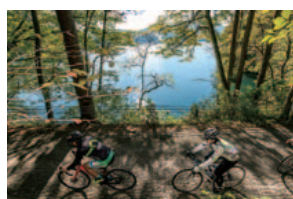
青木湖 北から、青木湖、中綱湖、木崎湖と連なる仁科三湖で最大の湖。水深は58mと深い。