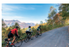
林道小熊黒沢線 鹿島槍スキー場から小熊山へ向かう林道は、木立の間から鹿島槍ヶ岳、爺ヶ岳が望めます。