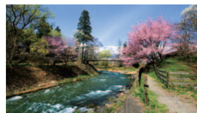
大出の吊り橋 姫川の清流、茅葺屋根の民家、四季折々の花、その奥に白馬の山々が雄大に聳える絶景スポット。