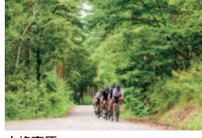
大峰高原 大町から東山の尾根道に上がると大峰高原。林の中を走る夏でも涼しいルート。