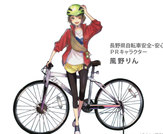
長野県自転車安全・安心PRキャラクター 風野りん