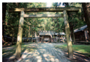
国宝 仁科神明宮 杉の大樹に囲まれた由緒ある神社で、本殿と中門は国宝。祭神は天照皇大神。