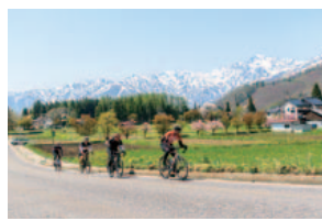
白馬岩岳 白馬駅から梅池高原へ向かうルートの中でも、特に気持ちよく走れる。右奥(右上)は五竜岳。