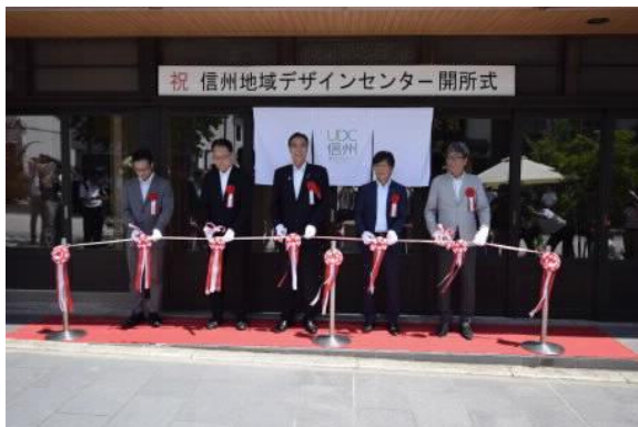
オープニング式典