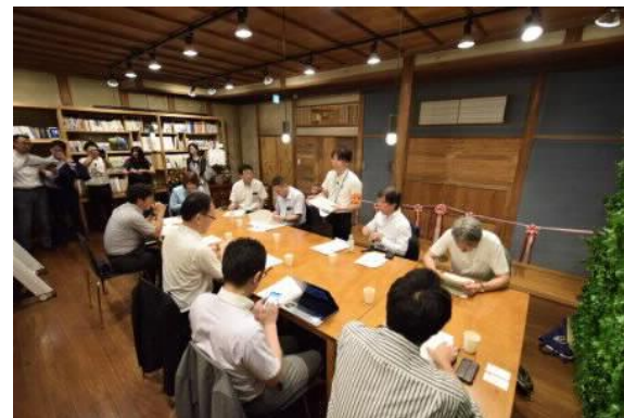
UDC信州事務所の様子