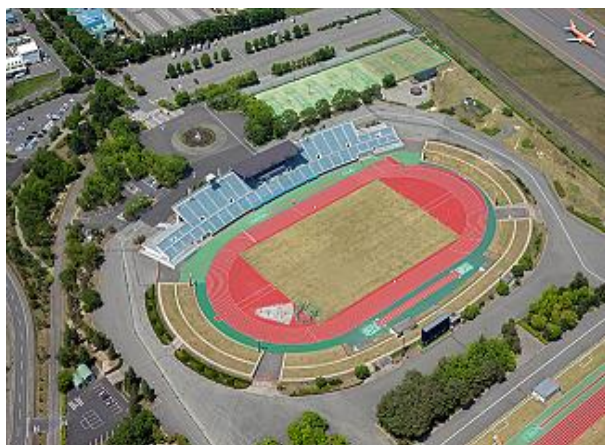
松本平広域公園陸上競技場 (昭和52年度供用開始) 国体総合開・閉会式場及び 陸上競技会場に決定