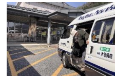
広域路線バスの共同運行